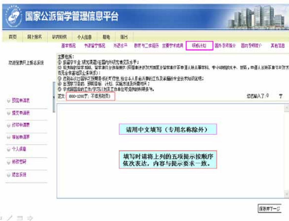
图 3-9 “研修计划表”填写页面