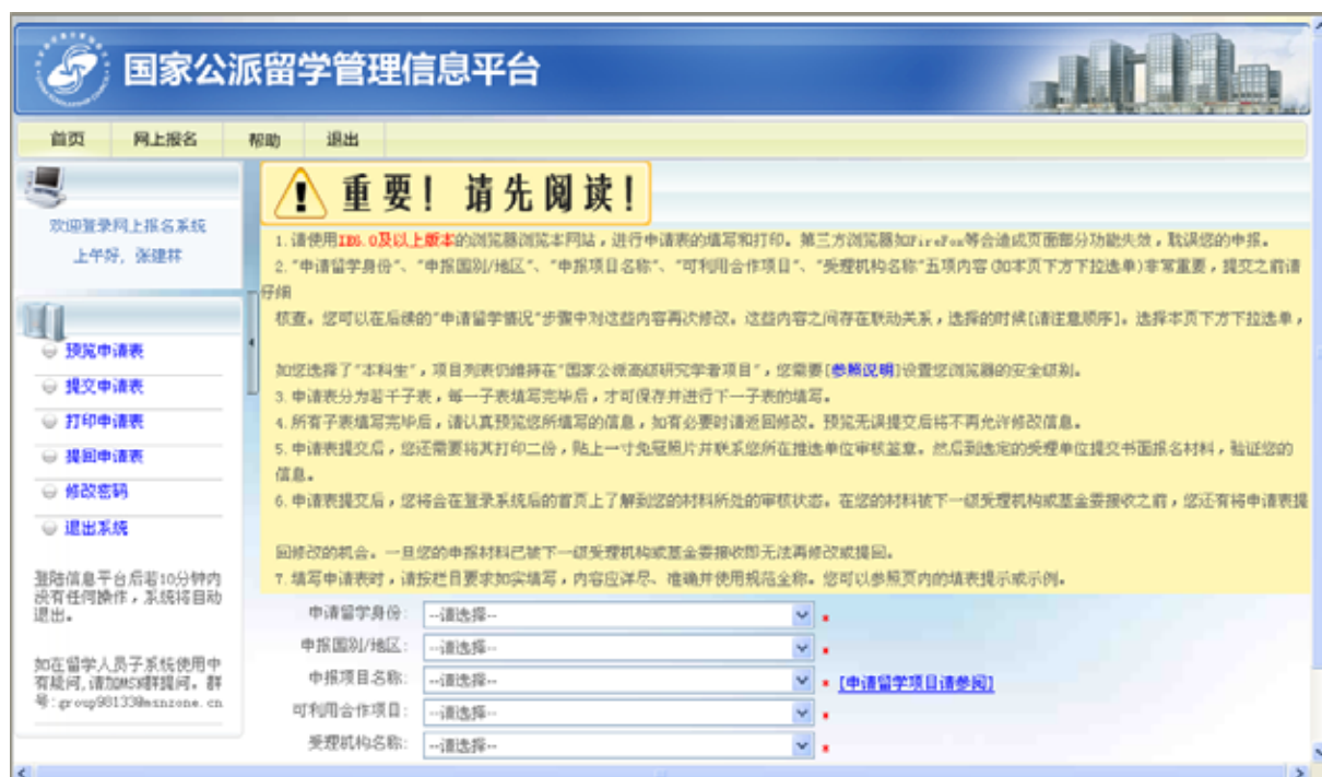
图 3-3 登录国家公派留学管理信息平台的界面