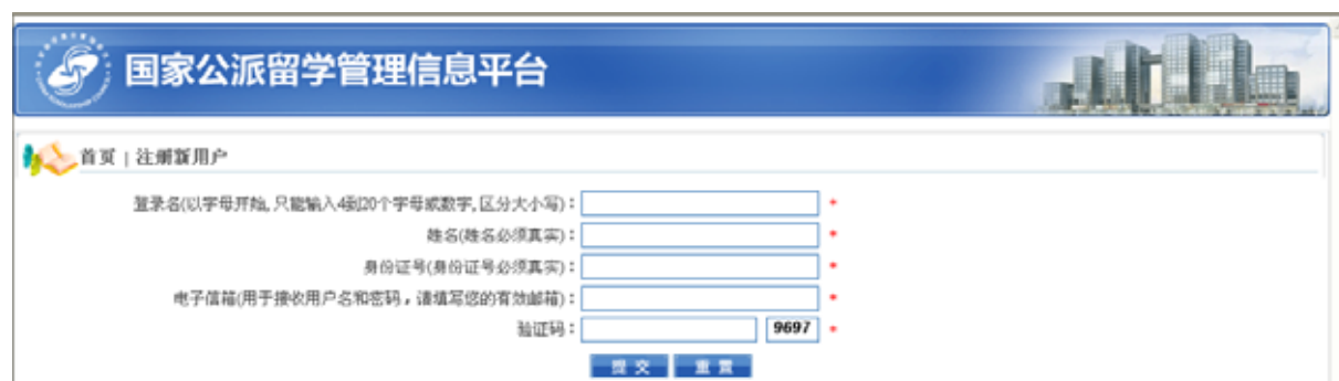
图 3-2 留学基金委信息管理界面新用户注册界面

（2）申请人打开浏览器，输入网址 http://apply.csc.edu.cn ，在页面左上方的“用户登录”中填入用户名和密码（如图 3-1 所示），即可登录国家公派留学管理信息平台（如图 3-3 所示）。申请人初次登录系统后，建议使用“修改密码”功能将密码重置。信息平台将陪伴留学人员的报名、录取