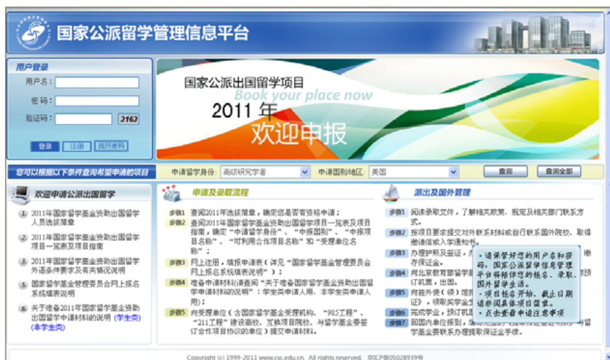
图 3-1 留学基金委信息管理界面

（1）申请人打开浏览器，输入网址 http://apply.csc.edu.cn ，登录到国家公派留学管理信息平台（如图 3-1 所示）。页面的左上方是用户登录入口，点击“注册”，即可进入申请人注册界面（如图 3-2 所示），输入基本信息进行注册，注册成功后，用户的用户名和初始密码将发送到注册时填写的邮箱。