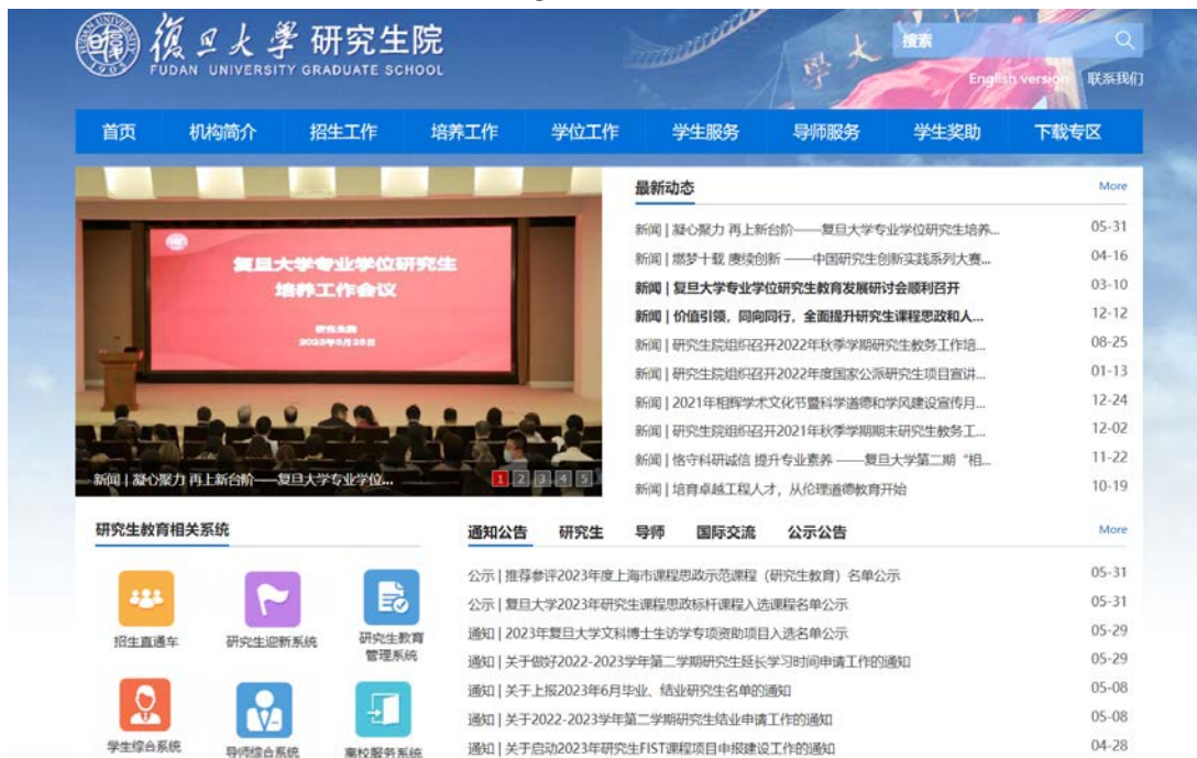
图 1 研究生院主页

研究生院网站在“通知公告”等栏目中发布各类通知信息。左侧有研究生教育相关系统链接。“下载专区”包含各类表格下载。